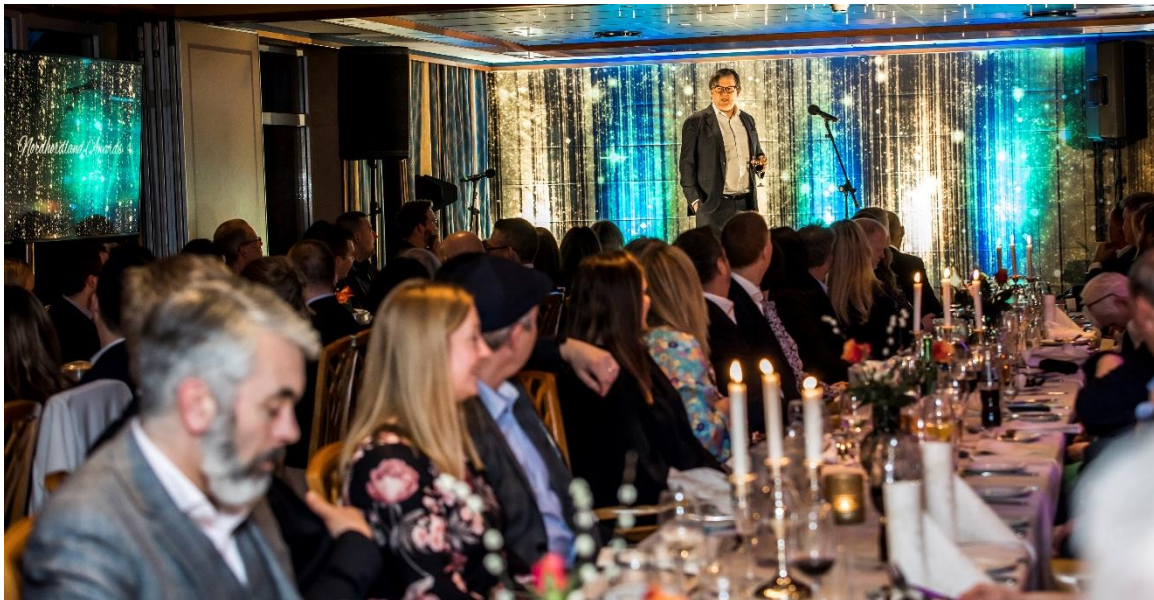
Nordhordland Awards 2022

Nordhordland Awards er eit samarbeid mellom Nordhordland Næringslag, Industriutvikling Vest, Alver kommune og Sparebanken Vest. Arrangementet vart utsett til 31. mars og samla 135 personar til prisutdelingar og feiring av næringslivet på Alver Hotel.