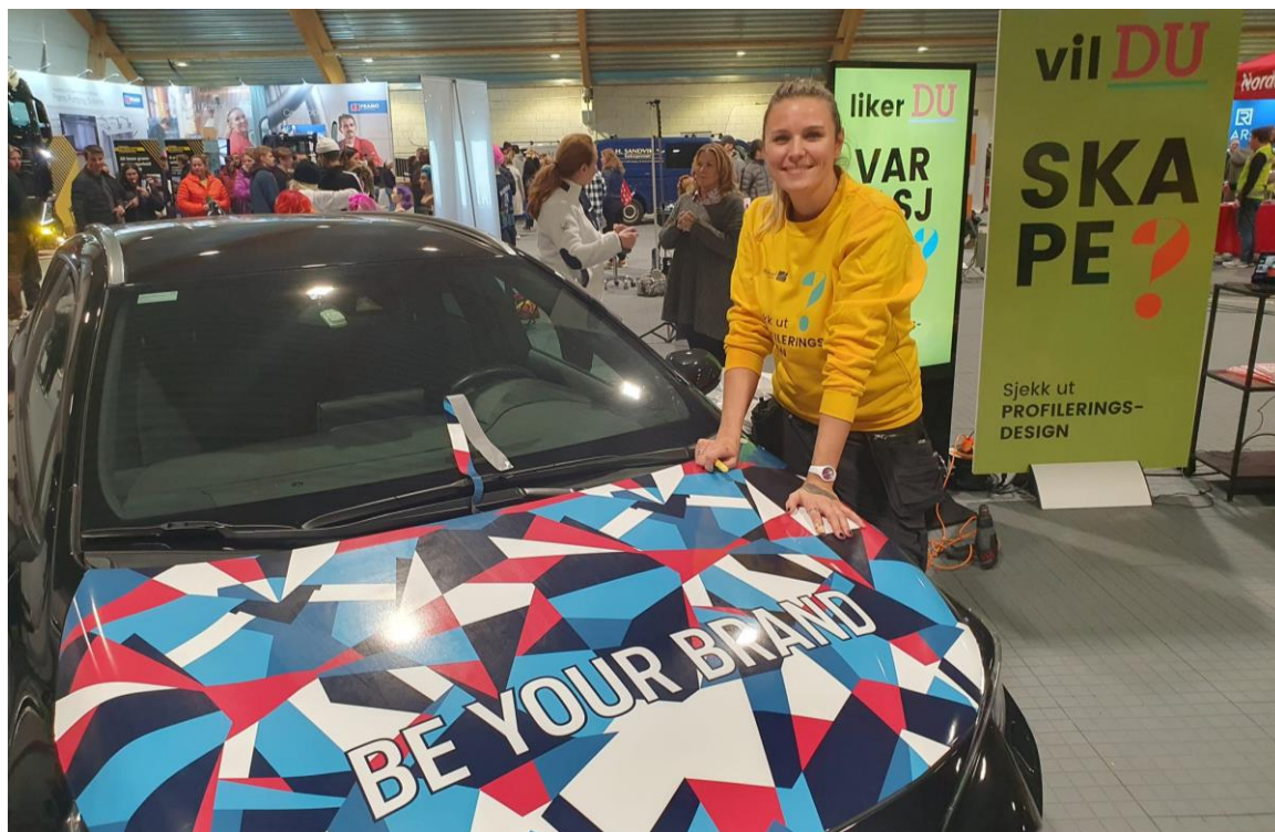
Frå yrkes- og utdanningsmessa