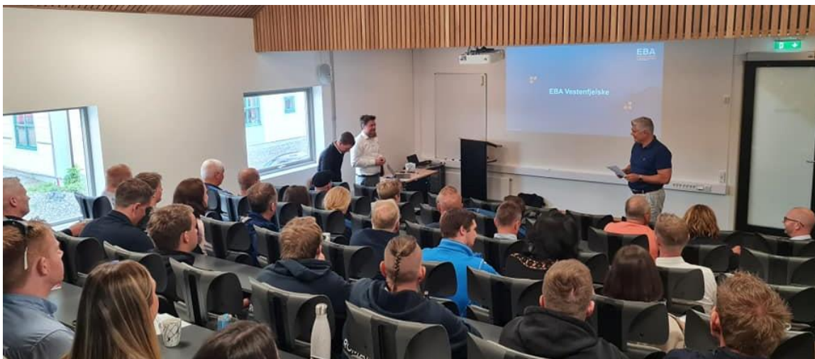
Fagseminar i Dampen før Danmarksturen